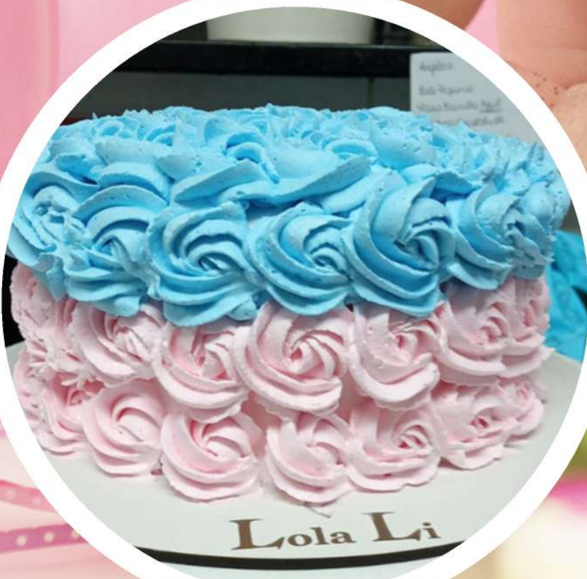
Decoração OPÇÃO 1

Bolo de chocolate, recheado com nosso creme de "brigadeiro" e coberto por creme de chocolate. Decorado com mini brigadeirinhos. Tudo adoçado somente com maçã, uvas passas e tâmaras.