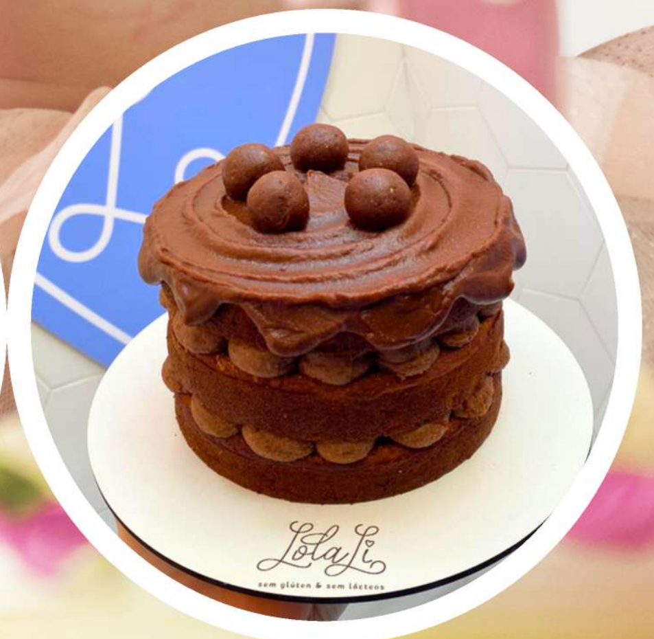
Decoração OPÇÃO 2